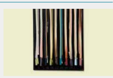
フォーマル帯メ 参考価格14,000円の品 4,800円~