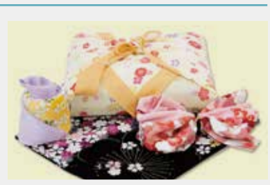
友禅風呂敷 参考価格2,000~2,800円の品 1,000円~