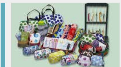
和雑貨コーナー 和装用や、かわいい和柄の小物たちが勢揃い!!