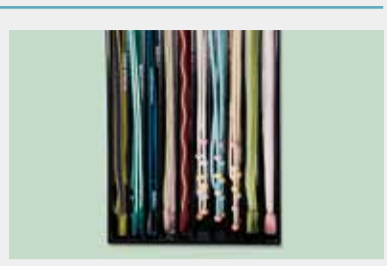
おしゃれ帯メ 参考価格12,000円の品 4,800円~