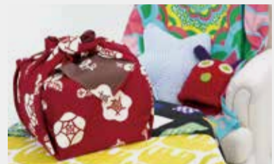
大判風呂敷 参考価格2,000~2,800円の品 1,500円~