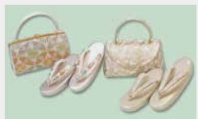
草履バッグセット 参考価格38,000円の品 16,800円~