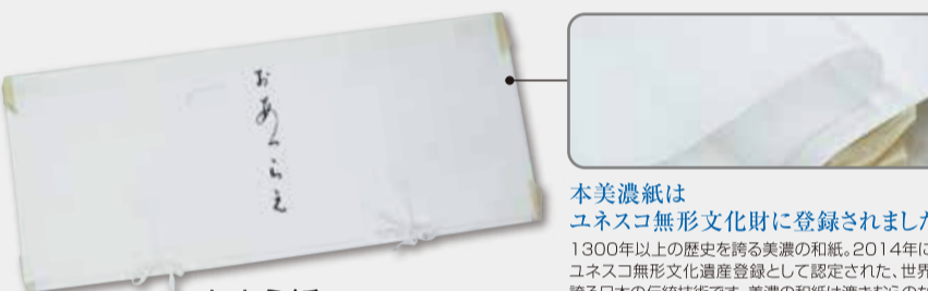
たとう紙 780円 美濃のたとう紙[5枚組]

本美濃紙は ユネスコ無形文化財に登録されました。 1300年以上の歴史を誇る美濃の和紙。2014年には ユネスコ無形文化遺産登録として認定された、世界に 誇る日本の伝統技術です。美濃の和紙は漉きむらのない 「薄く」「強く」「むらのない」優秀な紙として評価されて います。通気性が良く、着物の保蔵には大変優れています。