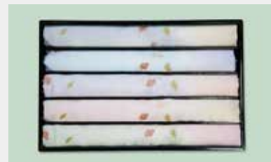
礼装用帯揚 参考価格15,000円の品 5,800円