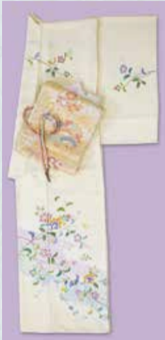
京加賀友禪訪問着 参考価格238,000円の品 特別価格 88,000円