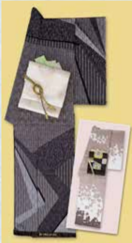
おしゃれ訪問着 参考価格198,000円の品 特別価格 69,800円