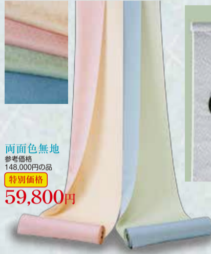
両面色無地 参考価格148,000円の品 特別価格 59,800円