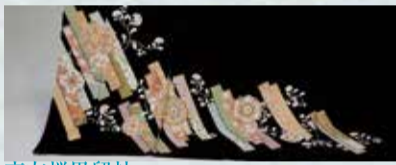
京友禪黒留袖 参考価格398,000円の品 特別価格 98,000円