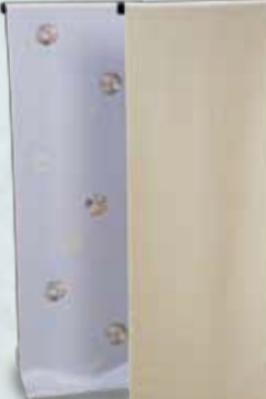
小紋 参考価格68,000円の品 特別価格 19,800円