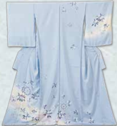
京加賀友禪訪問着 参考価格238,000円の品 特別価格 88,000円

屋代駅前商店街駐車場も (西沢楽器様裏側) ご利用ください。駐車券差し上げます。