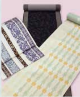
博多八寸帯 参考価格158,000円の品 特別価格 39,800円