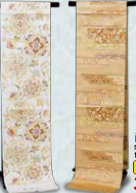
西陣袋帯 参考価格128,000円の品 特別価格 38,000円