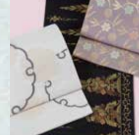
九寸帯 参考価格128,000円の品 特別価格 19,800円