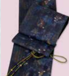
しゃれ袋帯 参考価格168,000円の品 特別価格 69,800円