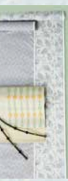
本場白大島紬 参考価格198,000円の品 特別価格 69,800円