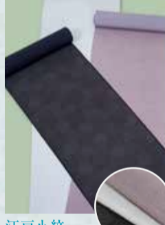
江戸小紋 参考価格88,000円の品 特別価格 29,800円