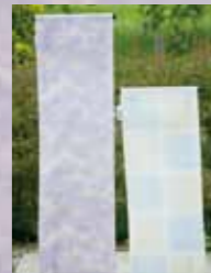
スリーシーズンコート 参考価格158,000円の品 特別価格 29,800円