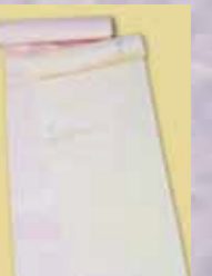
正絹長襦袢 参考価格38,000円の品 特別価格 16,800円