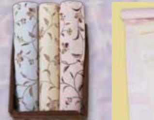
正絹友禅長襦袢 参考価格38,000円の品 特別価格 16,800円