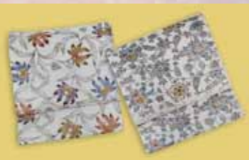
紅型九寸帯 参考価格148,000円の品 特別価格 29,800円