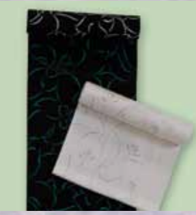
おしやれ小紋 参考価格148,000円の品 特別価格 69,800円