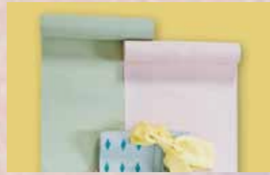
お召着尺 参考価格158,000円の品 特別価格 69,800円