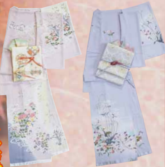
京加賀友禅訪問着 参考価格238,000円の品 特別価格 78,000円