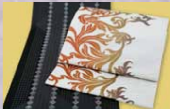
博多八寸帯 参考価格158,000円の品 特別価格 39,800円