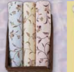
正絹友禅長襦袢 参考価格38,000円の品 特別価格 16,800円