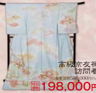
高級京友禅訪問着 参考価格580,000円の品 特別価格 198,000円

レーザー箔黒留袖 参考価格398,000円の品 特別価格 78,000円 西陣袋帯 参考価格128,000円の品 特別価格 38,000円 セットでこの価格 お買得 セット価格 98,000円