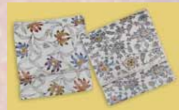
紅型九寸帯 参考価格148,000円の品 特別価格 29,800円