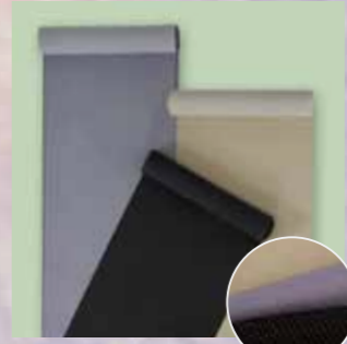
江戸小紋 参考価格88,000円の品 特別価格 29,800円