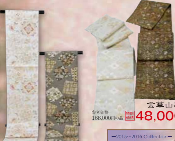
金華山袋帯 参考価格168,000円の品 特別価格 48,000円