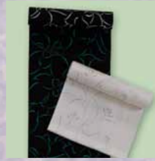
おしやれ小紋 参考価格148,000円の品 特別価格 69,800円