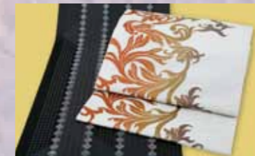
博多八寸帯 参考価格158,000円の品 特別価格 39,800円