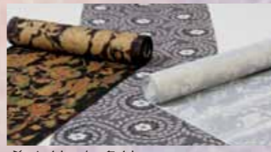
希少紬・有名紬 参考価格238,000円の品 特別価格 69,800円