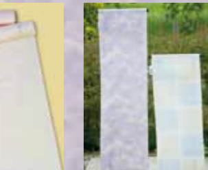
正絹長襦袢 参考価格38,000円の品 特別価格 16,800円