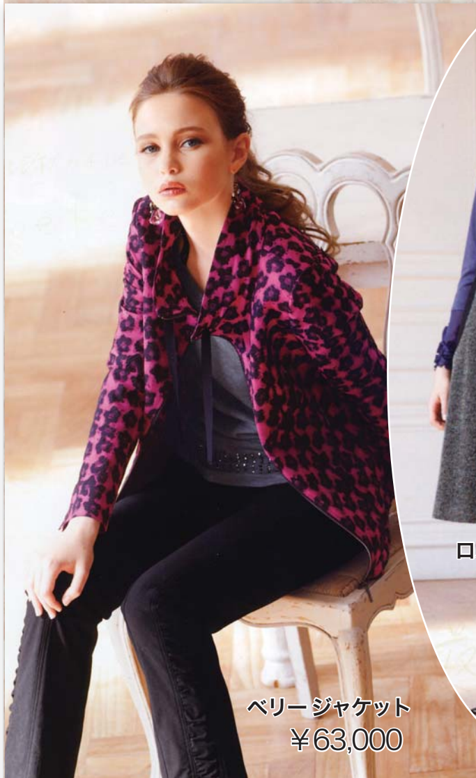
ベリージャケット ¥63,000

10/1(木)~10/4(日) 9:30~19:00 (最終日は 17:00まで)