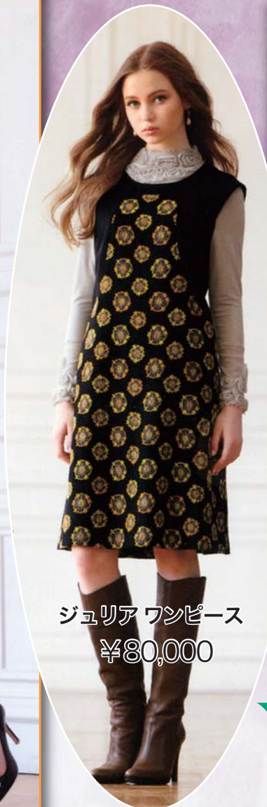
ジュリアワンピース ¥80,000