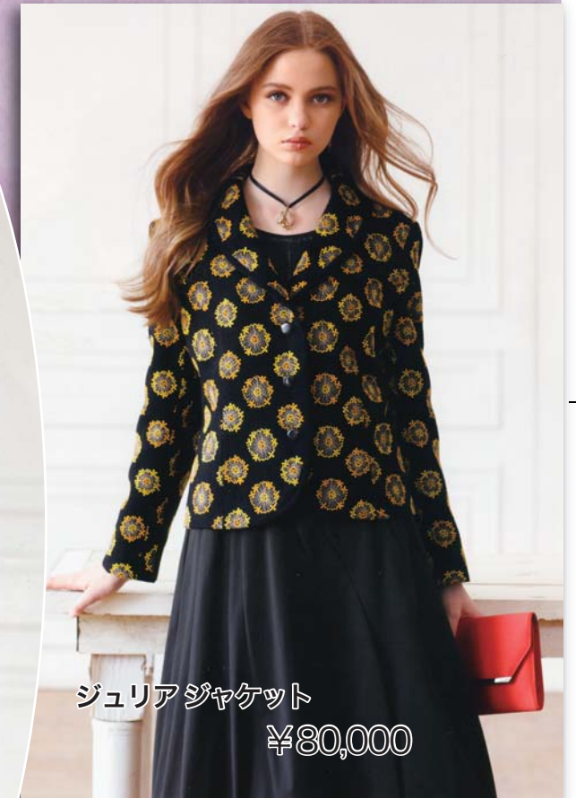
ジュリアジャケット ¥80,000

ローン 10回払いまで手数料サービス LADY'S SHOP きもの・寝装 全日本きもの振興会加盟店 やまとや 屋代駅前 ふれあい通り 0272-0077 FAX272-0090 http://yamatoya529.com