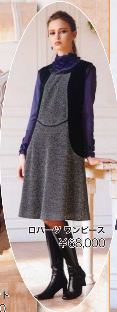
ロバーツワンピース ¥68,000